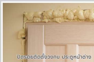
ปิดรอยต่อตั้งวงกบ ประตูหน้าต่าง