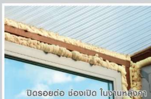
ปิดรอยต่อ ช่องเปิด ในงานหลังคา