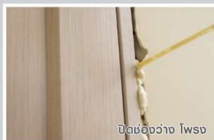
ปิดช่องว่าง ไพรบ