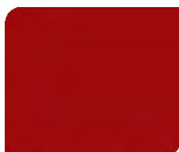
Flash Red T-022