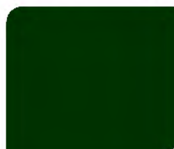
Forest Green T-007