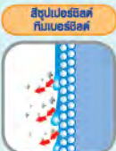
ผนังไม่ดูดซับน้ำ ฟิล์มสียึดเกาะแน่น

ฟิล์มสีมีโมเลกุลพลาแกมลักษณะ เป็นตาข่าย (Cross Linking) จึงไม่อนน้ำ และ สิ่งสกปรกไม่ซึมเข้าในฟิล์มสี ทำให้สามารถ สลยสิ่งสกปรกจาก พื้นลเองที่เกาะฟิล์มสีได้ด้วยน้ำ