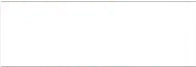
ฟิล์มสี เนียนกว่าไม่เหลืองตัว