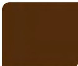
Mission Brown T-005