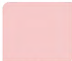
Victorian Pink T-019