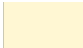
R203 HAPPY IVORY जाเข้าง