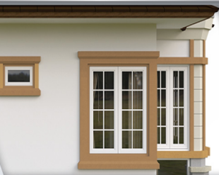
ตัดขอบผนัง