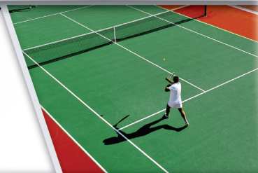
สนามกีฬา