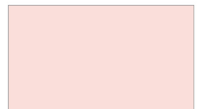
R707 ROSE QUARTZ ชมพูกุหลาบ

*เครื่องหมายรูปดาว ★ = มีสินค้า 2 ขนาด (1แกลลอน(GL) และ 1/4 แกลลอน (GL))