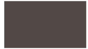
R699 BROWN สีน้ำตาล