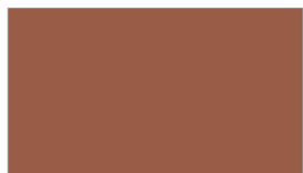
R292 ★ TEAK ไม้สัก