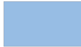
R403 SKY BLUE ฟ้าสดใส

*ในกรณีทากับพื้นผิวเก่าที่มีสีเดิมอยู่แล้ว ควรเตรียมพื้นผิวด้วยการล้างทำความสะอาดคราบสกปรก