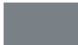
R582 WINTER GREY เทาหิมันต์