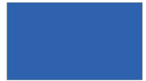
R410 ★ OCEAN BLUE น้ำเงินน้ำทะเล