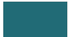
R313 MARIME GREEN เขียวสมุทร