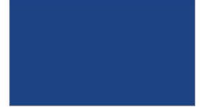
R491 MED BLUE น้ำเงินฟิล์ม