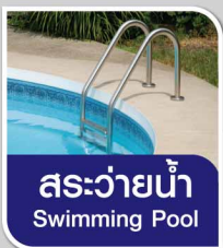
สระว่ายน้ำ Swimming Pool