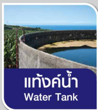
แท็งก์น้ำ Water Tank