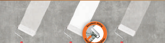
แบรินต์ A นิปปอนเพนต์ 5200 วอล ซีลเลอร์ แบรินต์ B

ภาพจำลองจากผลทดสอบจริง โดยนิปปอนเพนต์ รองพื้นเป็นอีกหนึ่งปัจจัยที่จะทำให้สีทับหน้ามีประสิทธิภาพที่ดีขึ้น