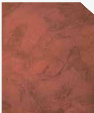
สีแดง / Red Clay Tile #AF-0201