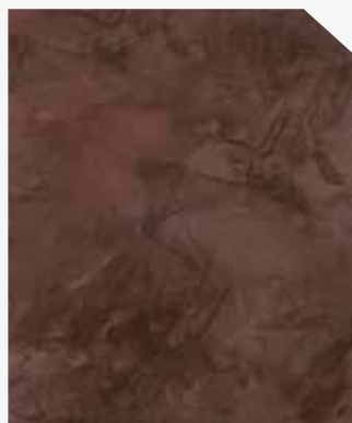
สีน้ำตาลเข้ม / Dark Brown #AF-0203