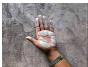
ปัญหาฝุ่นซอลค