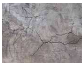
ปัญหาผนังแตกร้าว