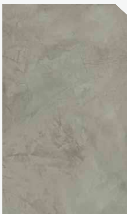
สีเทาเข้ม / Dark Grey #AF-0103