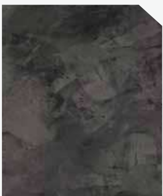
สีดำ / Dark Black #AF-0207