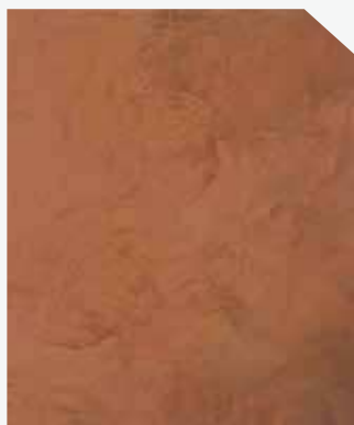
สีส้ม / Orange Punch #AF-0202