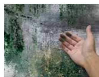
ปัญหาเชื้อราและตะไคร่น้ำ