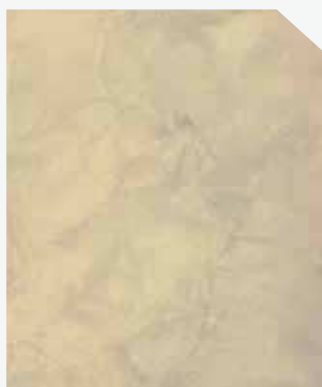
สีครีม / Cream #AF-0206