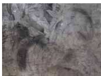
ปัญหาสีเป็นจ้ำ

ปัญหาเหล่านี้จะหมดไป เมื่อทาสีปูนฉาบเบเยอร์ชิลด์ ลอฟท์