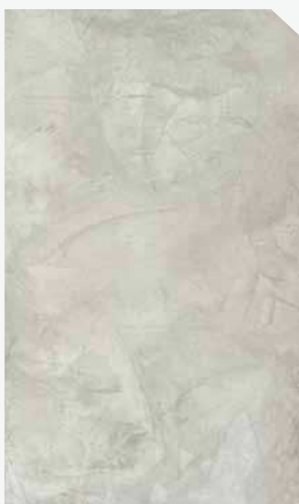
สีเทาอ่อน / Light Grey #AF-0102