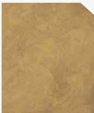
สีเหลือง / Yellow #AF-0205