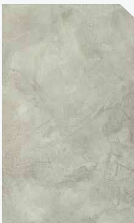
สีธรรมชาติ / Natural Grey #AF-0101

หมายเหตุ : รหัสสินค้า AF-02XX เป็นเจดสีสังเคราะห์ : ตัวอย่างเจดสีนี้ใกล้เคียงกับสีจริงเท่านั้น