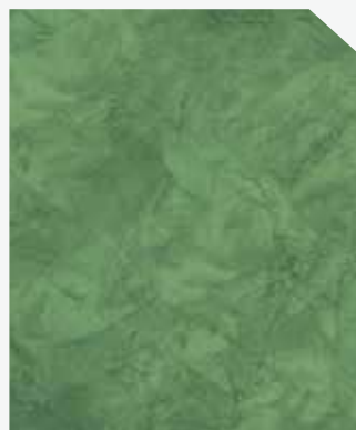
สีเขียว / Green #AF-0204