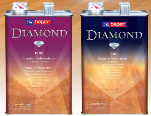
สำหรับภายในที่ลิ้มฉัสแดด

เหมาะสำหรับทา พื้นไม้ พื้นปาร์เก้ พื้นบันได เฟอร์นิเจอร์ไม้และไม้ทุกชนิดที่เป็นส่วนประกอบ ตกแต่งบ้าน รวมทั้งพื้นสนามกีฬาในร่ม รางโถวลิ้ง พลอร์สลิลาค โต๊ะอาหาร โต๊ะทำงาน เก้าอี้ ประตู หน้าต่าง วงกบ และพื้นคอนกรีต