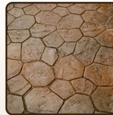
พื้นคอนกรีตพิมพ์ลาย Stamped Concrete