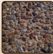
ทรายล้าง Wash Gravel