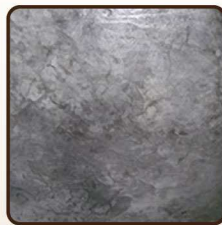
ผนังปูนขัดมัน Polished Cement Wall