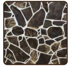
หินกาบ Slate Tile