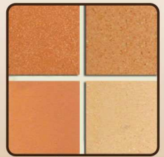
กระเบื้องดินเผา (ไม่เคลือบ) Non-Coated Earthenware