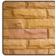
กระเบื้องหินทราย Sandstone Tile

เหมาะสำหรับ กระเบื้องหล่อหินทราย พื้นคอนกรีตพิมพ์ลาย พื้นผิวคอนกรีต ผนังปูนขัดมัน พลาสติกซีเมนต์ ซีเมนต์ไฟเบอร์บอร์ด อิฐทราย อิฐดินเผา คอนกรีตมวลเบา ผนังอิฐบล็อก หินธรรมชาติ สีซิลิเกต หินอ่อน หินแกรนิต หินกาบ กรวดล้าง ทรายล้าง กระเบื้องดินเผาชนิดยังไม่เคลือบ เป็นต้น