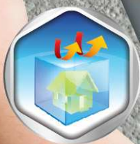
ผสมเซรามิกกันร้อน ทำให้บ้านเย็น