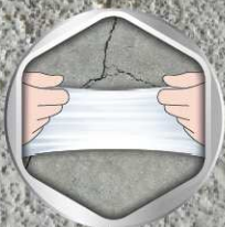
ฟิล์มสียึดหยุ่น ปกปิดรอยแตกกลายงา