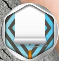
ฟิล์มขาวทาสีขึ้นง่าย ประหยัดสีกับหน้า