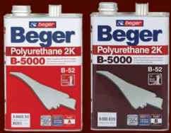
เบเยอร์ โพลียูรีเทน B-5000 (E-510 / E-511)