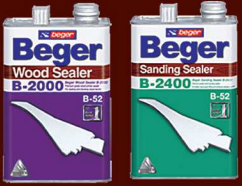
เบเยอร์ B-2000 เบเยอร์ B-2400