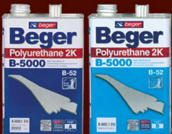
เบเยอร์ โพลียูรีเทน B-5000 (I-510 / I-511 / I-513 / I-515)