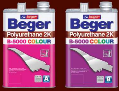
เบเยอร์ โพลียูรีเทน B-5000 คัลเลอร์