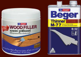
เบเยอร์ วู้ด ฟิลเลอร์ ทินเนอร์ M-77