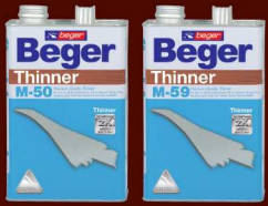
ทินเนอร์ เบเยอร์ M-50 ทินเนอร์ เบเยอร์ M-59 ลดรอยแปรง เหมาะกับฟิล์มสี ชนิดด้าน และชนิดกึ่งมัน