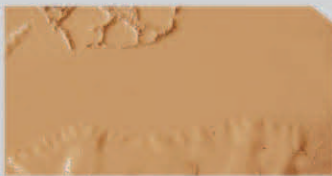
สีโป่งพอง (Blistering)