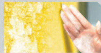
สีเป็นฝุ่นซอลค์ (Chalking)