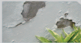
สีลอก่อน (Peeling)