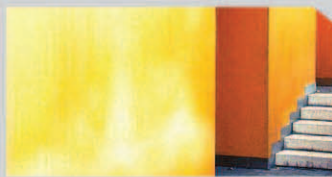
สีซีดจาง (Fading)