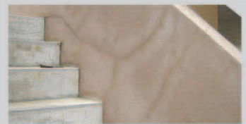
สีเป็นคราบเกลือ (Efflorescence)