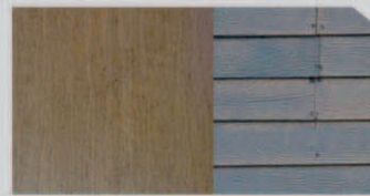
สีไม่เกาะพื้นผิว (Poor Adhesion)