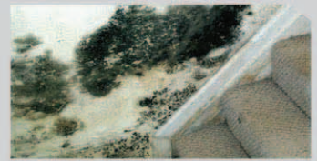
เชื้อราและตะไคร่น้ำ (Fungi and Algae)