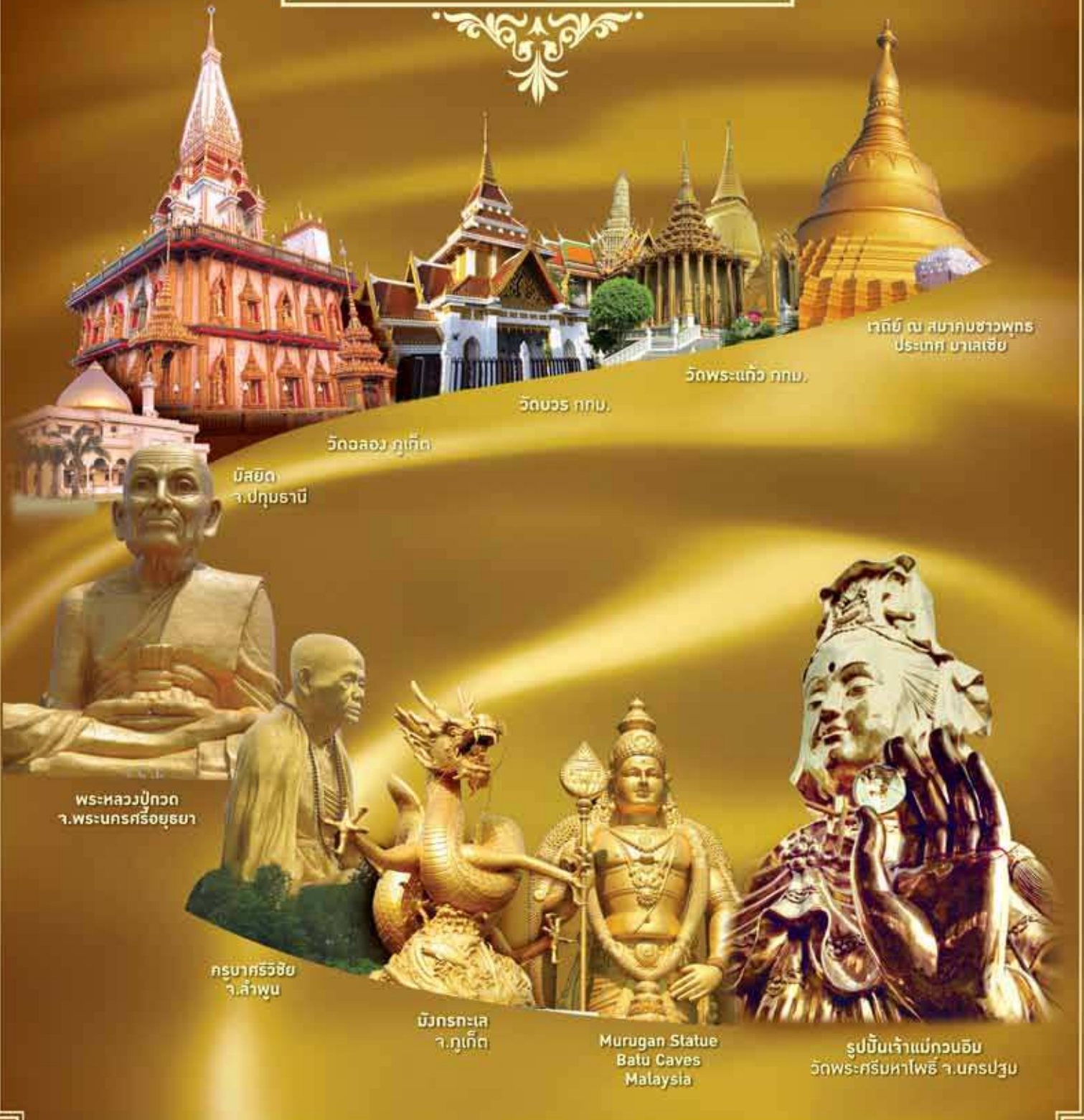
เจดีย์ ณ สมาคมชาวพุทธ ประเทศ มาเลเซีย