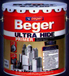
1 แกลลอน, 15 ลิตร