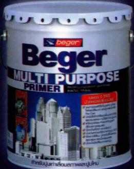
1 แกลลอน, 5 แกลลอน