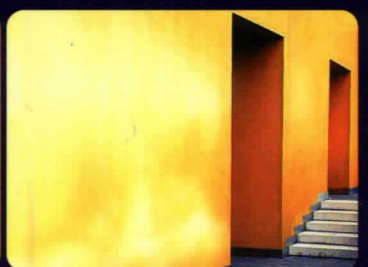
สีซีดจาง