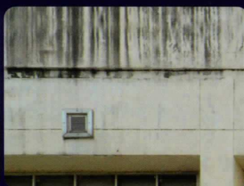
เชื้อรา และตะไคร่น้ำ