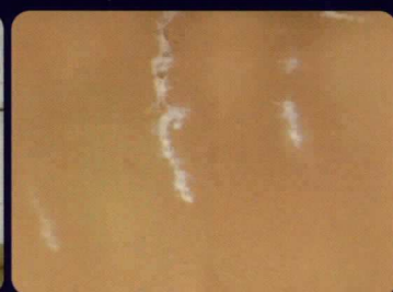
สีเป็นคราบเกลือขาว