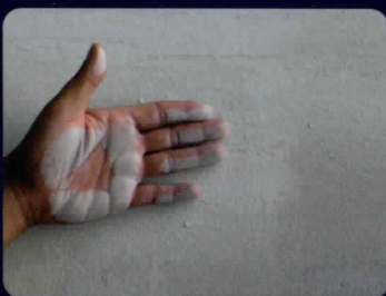
สีเป็นฝุ่นซอลก์

ยุติทุกปัญหาที่เกิดขึ้น ปกป้องปัญหาใหม่ พร้อมป้องกันปัญหาเดิมไม่ให้เกิดซ้ำ