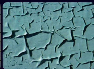
สีลอกล่อน