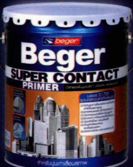
1 แกลลอน, 5 แกลลอน