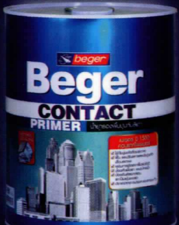
1 แกลลอน, 5 แกลลอน